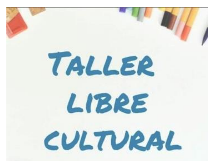
LIBRE CULTURAL Asincrónico MÓNICA DURÁN