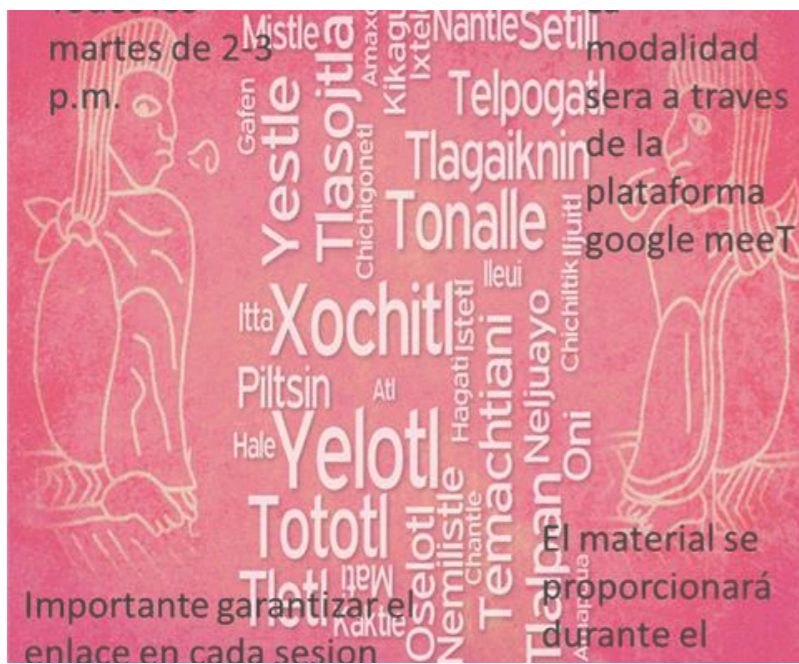
LENGUA Y CULTURA NÁHUATL Martes 14:00 a 17:00hrs GABINO TEPETATE