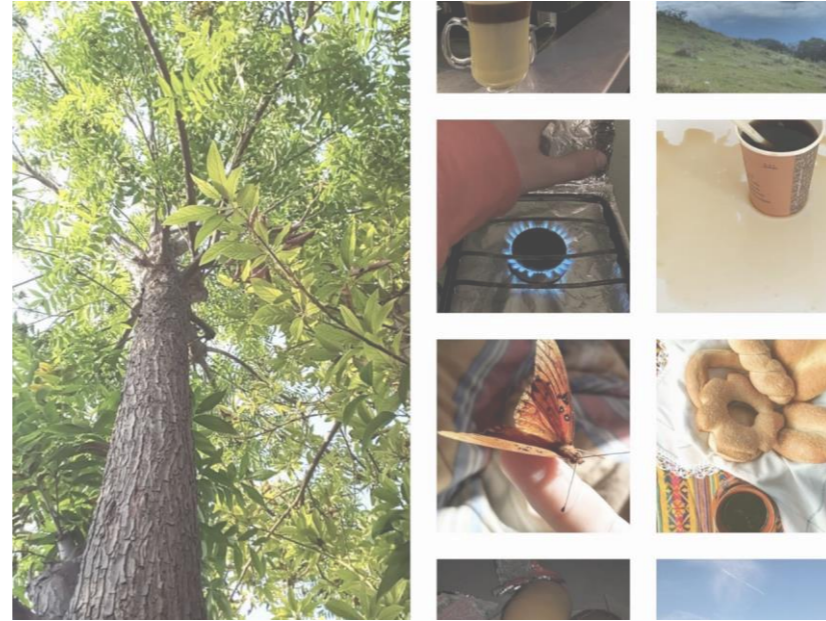
5 SENTIDOS: TALLER DE PERCEPCIONES Martes Jueves 14:00 a 15:30hrs ERANDI VEGA